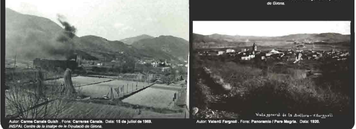
Autor: Carme Canals Guich. Font: Carreres Canals. Data: 15 de juliol de 1969. INSPA. Centre de la imatge de la Diputació de Girona.