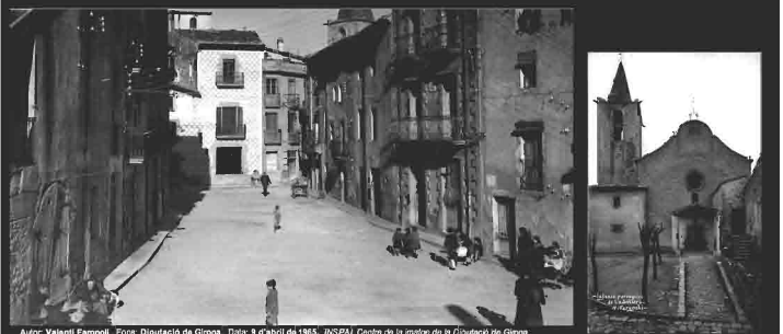
Autor: Valentí Fargnoli. Font: Diputació de Girona. Data: 9 d'abril de 1963. INSPA. Centre de la imatge de la Diputació de Girona.