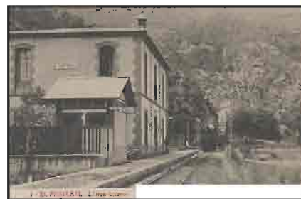
Data: 1900 - 1919.

Si bé té la consideració de nucli agregat i, per tant, disposa de tots els condicionats urbans, el sector del Pasteral, conegut també com a veïnat de Francesc, està dividit en dos petits sectors clarament diferenciats: el carrer de les Brugues (part de la riuera) i el veïnat de St. Francesc (la banda i banda de la C63).