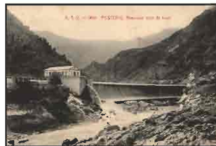
Data: 1900 - 1919.