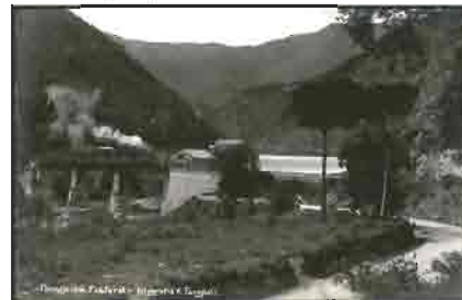
Data: 1911 - 1921.